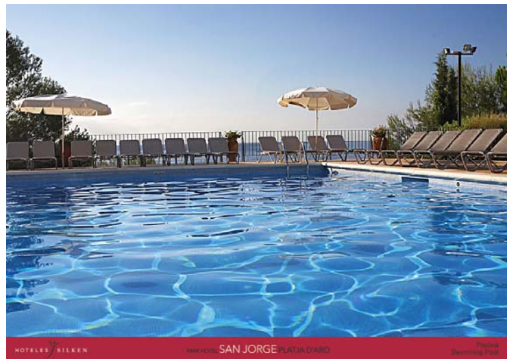
HOTELES SILKEN MAN HOTEL SAN JORGE PLATJA D'ADRO Private Swimming Pool