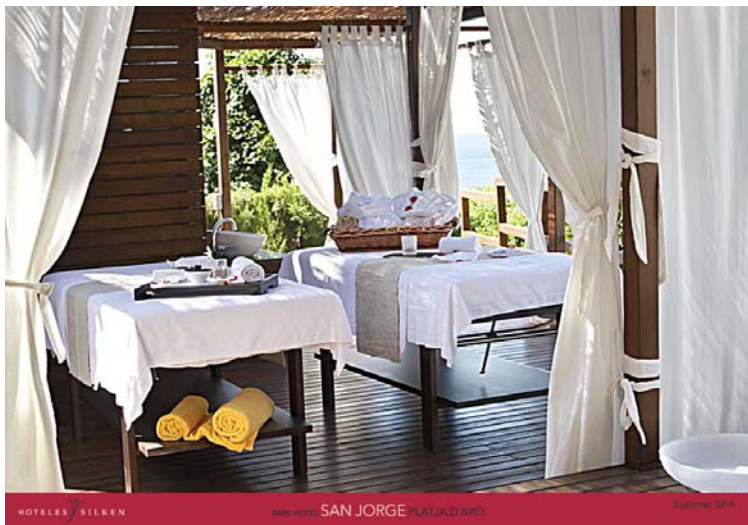
HOTELES SILKEN MAN HOTEL SAN JORGE PLATJA D'ADRO Summer SPA