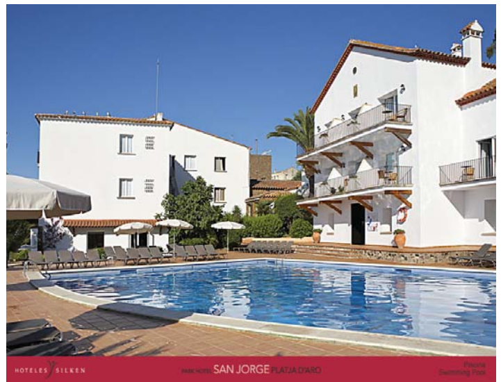
HOTELES SILKEN MAN HOTEL SAN JORGE PLATJA D'ADRO Private Swimming Pool