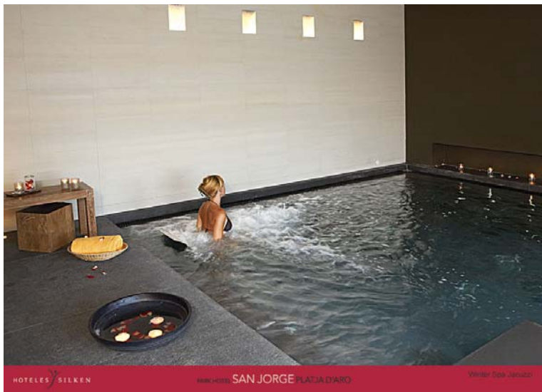
HOTELES SILKEN MAN HOTEL SAN JORGE PLATJA D'ADRO Winter Spa (January)